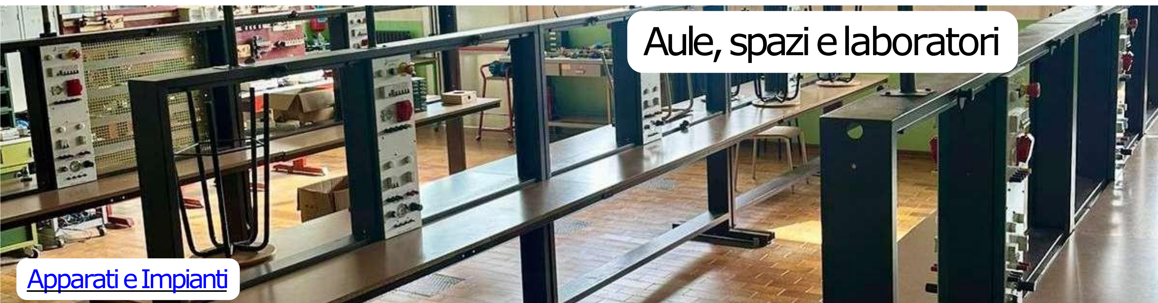
Apparati e Impianti