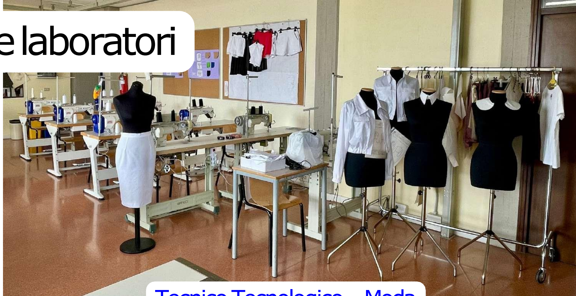
Tecnico Tecnologico – Moda