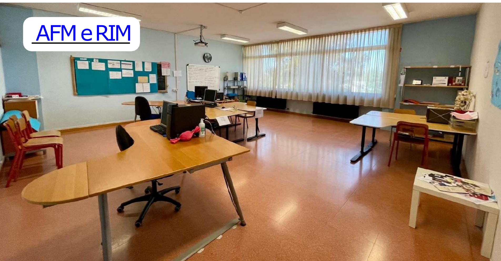
AFM e RIM