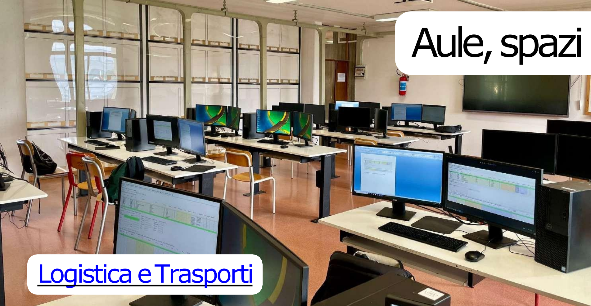
Logistica e Trasporti